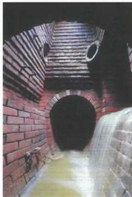
レンガ下水渠(矩形):明治33年5月竣工 レンガ下水渠(卵形):明治36年度竣工